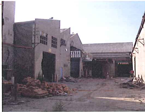
Antes del desamiantado.