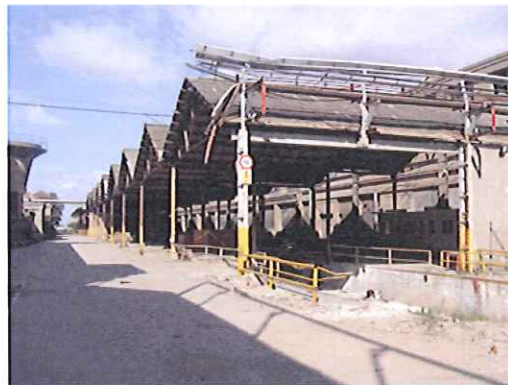
Antes del desamiantado.