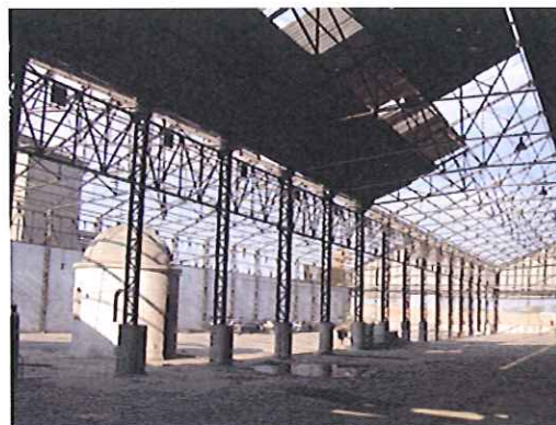
Después del desamiantado.

Todos los elementos de fibrocemento una vez desmontados se colocarán en palés y se envolverán con polietileno precintándose y colocando una carátula indicando el contenido de material de amianto contaminado, al igual que con las tuberías de fibrocemento.