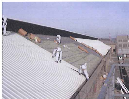
Los trabajadores con los epi's adecuados para el desamiantado.

Se comprobará que los trabajadores que han de intervenir en este proyecto hayan pasado las revisiones médicas específicas de trabajo en amianto y la formación en prevención de riesgos laborales y específicos del amianto. Antes del inicio de los trabajos se realizará una inspección ocular por el técnico de la empresa tanto de áreas a descontaminar de fibrocemento como de toda la zona de trabajo.